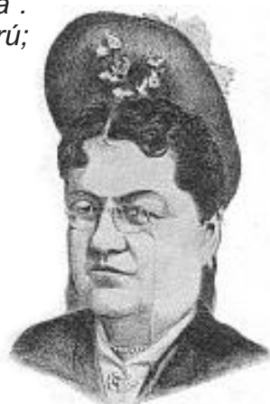
Clorinda Matto de Turner

Escribió "Tradiciones cusqueñas", "Aves sin nido", "Índole" y "Herencia". Con su novela Aves sin nido se inicia la narrativa indigenista en el Perú; pues, esta obra nos habla sobre la explotación que sufren los indios.