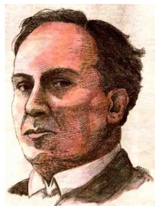
Antonio Machado (1875-1939) Poeta y prosista español, perteneciente al movimiento literario conocido como generación del 98.