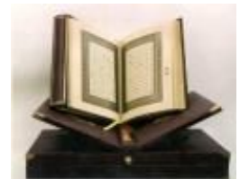
Mahoma y el Corán