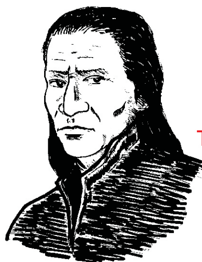
TÚPAC AMARU II

José Gabriel Condorcanqui cacique de Tinta, Surimana y Tungasuca