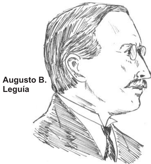
Augusto B. Leguía