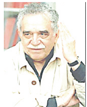
Gabriel García Márquez

“Creció entre fantasmas en un mundo mágico de supersticiones en el que su abuela hablaba con los muertos y una de sus tías cosía su mortaja”.