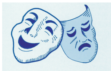
Máscaras que representan la comedia y la tragedia