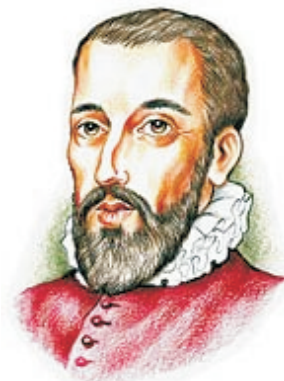
Inca Garcilaso de la Vega

Los cronistas fueron españoles, mestizos e indios, entre los cuales tenemos al Inca Garcilaso de la Vega y a Guamán Poma de Ayala, mestizo e indio respectivamente.