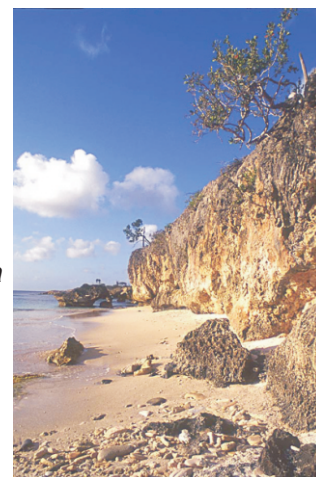
"Somos como la higuera"

Nosotros somos como la higuera, como esa planta salvaje que brota y se multiplica en los lugares más amargos y escarpados. Véanla cómo crece en el arenal, sobre el canto rodado, en las acequias sin riego, en el desmonte, alrededor de los muladares. Ella no pide favores a nadie, pide tan solo un pedazo de espacio para sobrevivir. No le dan tregua el sol ni la sal de los vientos del mar, la pisan los hombres y los tractores, pero la higuera sigue creciendo y propagándose, alimentándose de piedras y de basura. Por eso digo que somos como la higuera, nosotros la gente del pueblo. Allí donde el hombre de la costa encuentra una higuera, allí hace su casa porque sabe que allí podrá también él vivir. Nosotros la encontramos al fondo del barranco, en los viejos baños de Magdalena. Veníamos huyendo de la ciudad como bandidos porque los escribanos y los policías nos habían echado de quinta en quinta, de corralón en corralón. Vimos la planta allí, creciendo humildemente entre tanta ruina, entre tanto patillo muerto y tanto derrumbe de piedras, y decidimos levantar nuestra morada