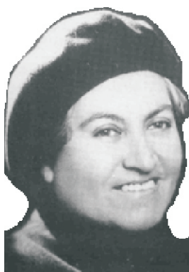
Chile 1899 - New York 1957

Hija de un maestro rural, que abandonó el hogar a los tres años del nacimiento de Gabriela, la muchacha tuvo una niñez difícil en uno de los parajes más desolados de Chile. La obra poética de Gabriela Mistral surge del modernismo, más concretamente de Amado Nervo, De Rubén Darío tomó, sin duda, la principal de sus características: el gusto por el lenguaje coloquial.