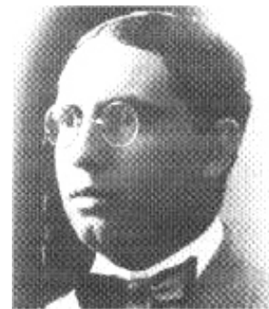
Abraham Valdelomar forma parte de un conjunto de escritores que en cierto sentido dan un carácter provinciano y local, al modernismo.

e) ¿Qué parte de la historia te da el indicio del lugar donde suceden los hechos?