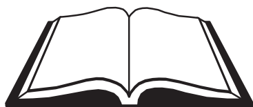
Constitución del Perú